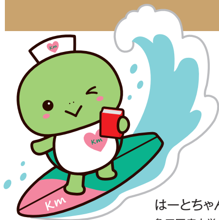
はーとちゃん 亀田医療大学 公式キャラクター